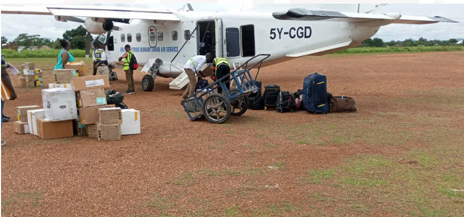
Un avion UNHAS se préparant à décoller vers Kalemie