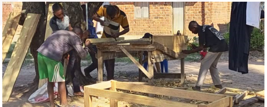
Vue des jeunes apprenant la menuiserie