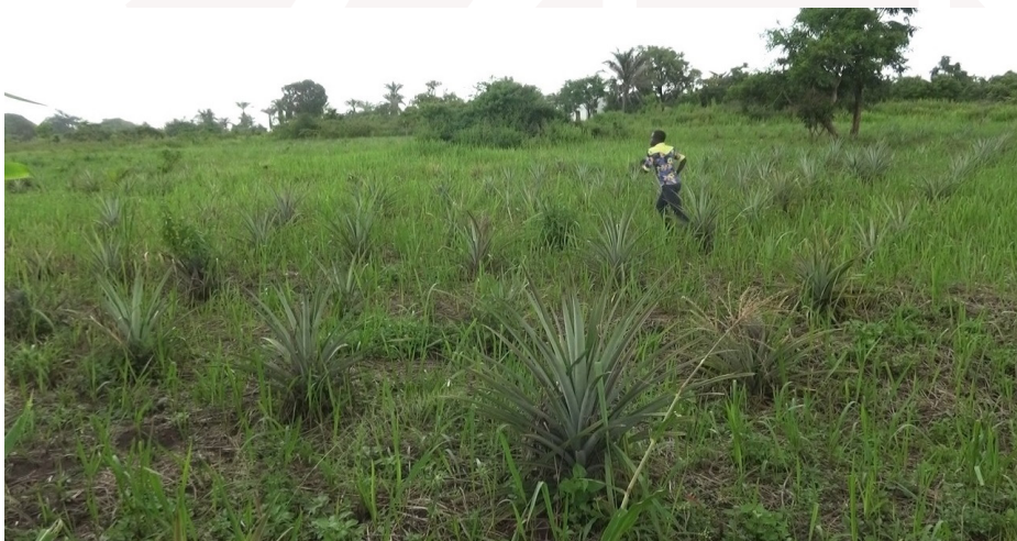
Des ananas en croissance dans la ferme