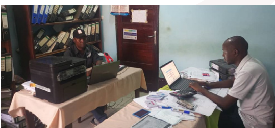
Deux des Comptables travaillant à Kongolo