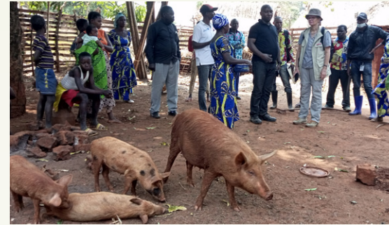
Une Délégué de Misereor visitant un projet de sécurité alimentaire par cet Organisme catholique allemand

Le Coordonnateur de la Caritas-Développement Kongolo a également salué le partenariat avec les Caritas Sœurs du Nord. « Nous avons à titre illustratif un grand programme de sécurité alimentaire avec l'appui de NORAD, via Caritas Norvège et Caritas Congo Asbl. Ca fait déjà plus de 10 ans que nous sommes avec Caritas Congo, avec l'appui de Caritas Norvège, avec le fond du gouvernement norvégien. Donc, c'est un grand partenariat que nous saluons en passant », a-t-il