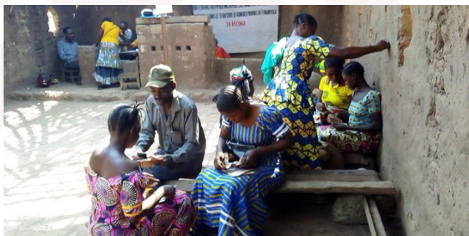
Des bénéficiaires en train compter le Cash reçu

La convention avec CRS s'articule autour du projet « DRIVE » : une réponse rapide aux personnes déplacées, retournées et familles d'accueil vulnérables. Le nombre des bénéficiaires dépend de l'alerte donnée dans la zone. Pour l'année 2022, par exemple, il y a eu une alerte sur le déplacement de la population. C'était en février 2022. Quand la situation sécuritaire était redevenue normale, Caritas Kongolo a procédé à l'identification des bénéficiaires dans l'Aire de Santé de Kateba.