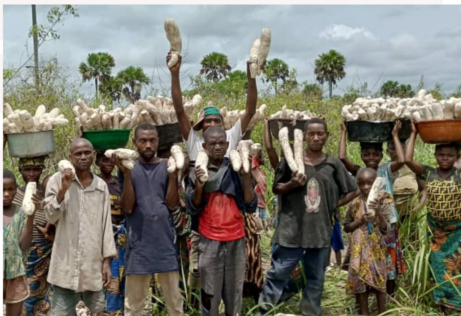
Des membres des Peuples Autochtones accompagnés par la Caritas-Développement Kongolo, brandissant des cossettes de manioc qu'ils ont produit

Dans ce registre, il y a également un projet de protection des enfants financé par l'UNICEF, dans le Territoire de Kongolo, précisément à Kongolo, Mbulula, Makutano et Ponda, ciblant 300 ménages ou 1.800 personnes.