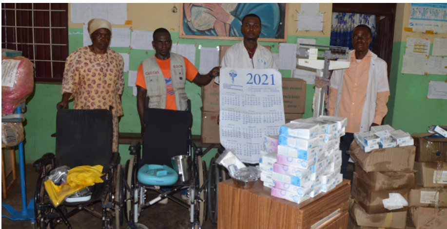
Appui du BDOM Kongolo à ses Structures sanitaires

Il y a également le projet d'appui à la promotion d'accès à l'eau potable par l'aménagement des sources dans le Territoire de Kongolo, précisément dans les Zones de Santé de Kongolo et Mbulula. D'une durée de trois ans, partant de 2022, ce projet est financé par la Caritas Bolzano.