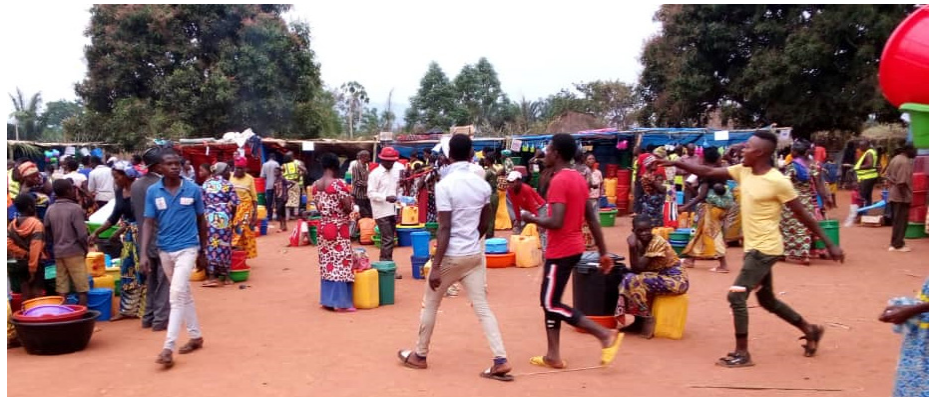
Ambiance lors d'une opération d'assistance humanitaire avec des opérateurs économiques

Une autre aide a visé 21.834 personnes, soit 3.700 ménages. « Nous avons pu apporter cette assistance grâce à l'appui financier de l'UNICEF/Bureau de Kalemie. Nous avons changé d'approche pour cette intervention : nous avons recouru au Cash à usage multiple. C'est-à-dire, nous donnons le Cash selon les ménages. Et chacun se