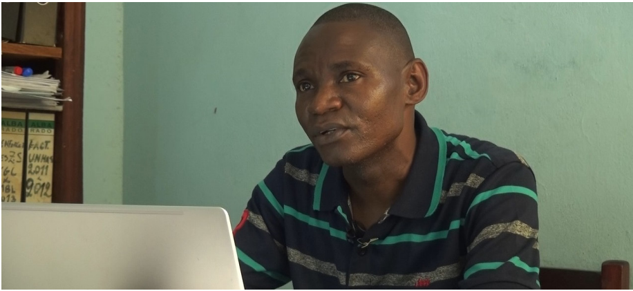
Deux des Comptables travaillant à Kongolo