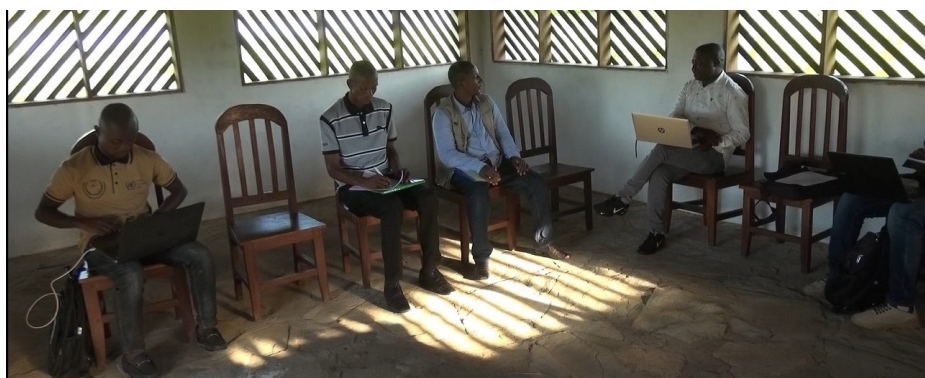
Vue des participants d'une réunion d'Inter-Agences à Kongolo

Concernant les Autorités Politico-Administratives, vous savez que nous venons en aide aux Gouvernants ; nous sommes contents qu'au niveau national et provincial, le Gouvernement, à travers son ministère des affaires humanitaires, mobilise aussi des fonds pour intervenir en cas de crise au de-là de l'apport des Partenaires ; c'est très encourageant.