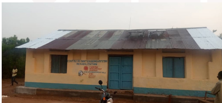
Réhabilitation du Centre de Santé Ekasenga Mpetshi

Par ailleurs, le projet de renforcement de la surveillance à base communautaire pour les cas de paralysie flasque aigue (PFA) s'exécute dans les Zones de Santé de Kitenge et Kabongo. Il est financé par la Fondation Bill et Melinda Gates.