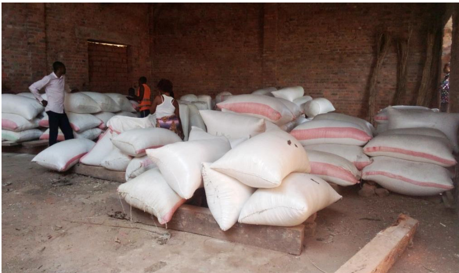
Des sacs de maïs produits par des ménages bénéficiaires du projet SECAL