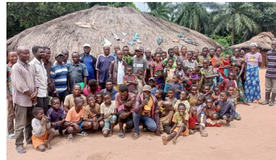
Les membres de l'Association « Umoja ni nguvu » de Lukemba

« Mon travail, c'est l'agriculture. J'ai utilisé une partie du fruit de mes récoltes pour cotiser régulièrement à notre association /AVEC. Au par-