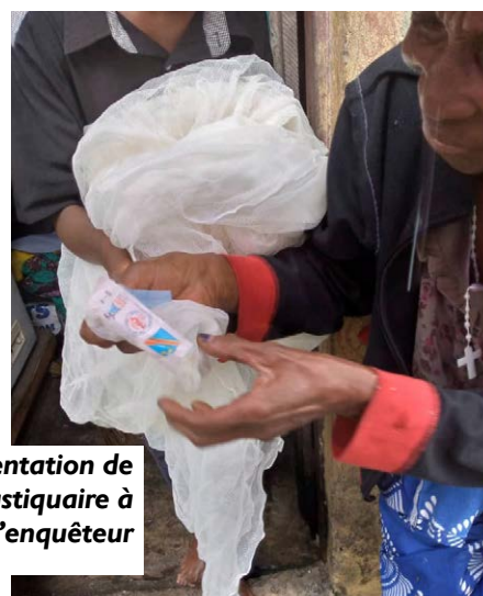
Présentation de la moustiquaire à l'enquêteur