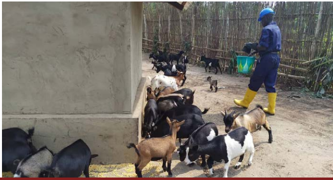
Chevrerie pilote dans le territoire d'Oshwe