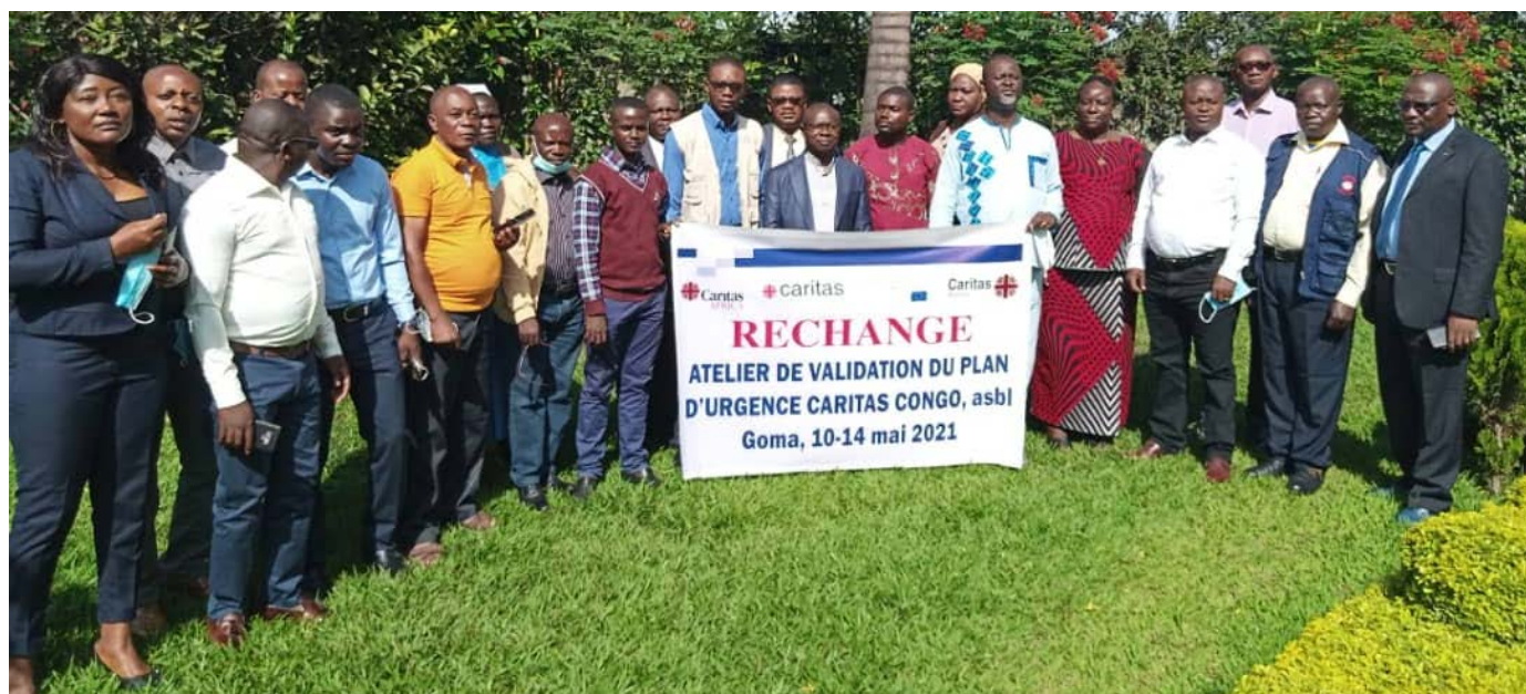
Des Représentants de différentes Caritas-Développement Diocésaines à l'atelier de « RECHARGE » à Goma

Pour accomplir sa mission, le Réseau Caritas Congo Asbl possède de biens nombreux (bureaux, meubles, centres d'accueil, fermes agricoles, charroi automobile, mini-barrages, usines et équipements divers), même dans les coins les plus reculés du pays.