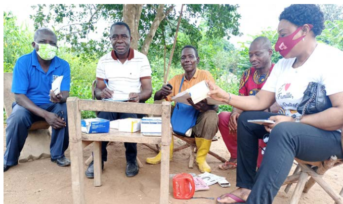
Visite d'un site de soins communautaires dans le Bas-Uélé