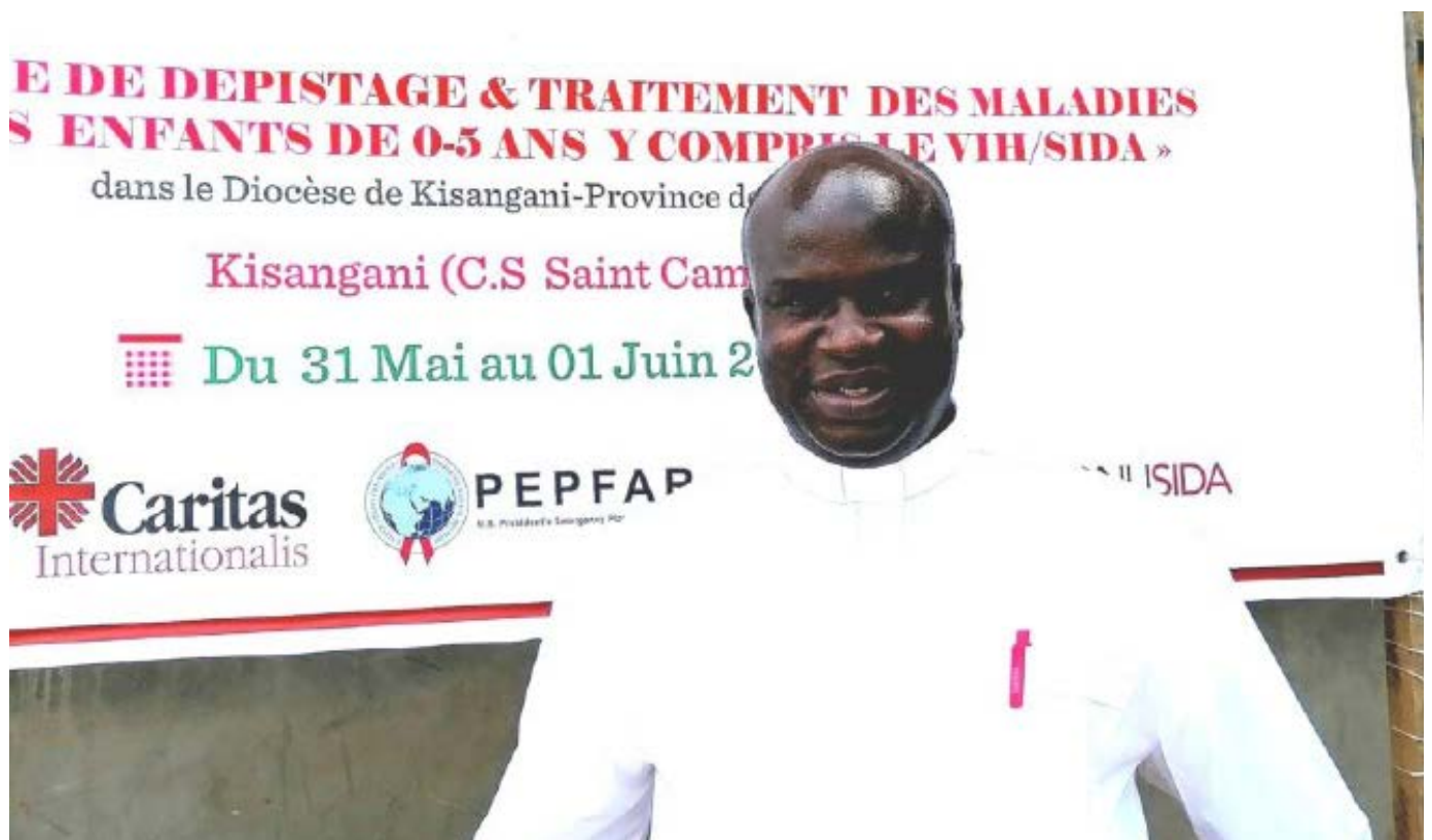
Le 1er Secrétaire Exécutif Adjoint de la Caritas Congo Asbl en suivi du Projet de renforcement de l'engagement des Organisations Confessionnelles dans l'accélération du diagnostic contre le VIH chez les enfants dans l'Archidiocèse de Kisangani