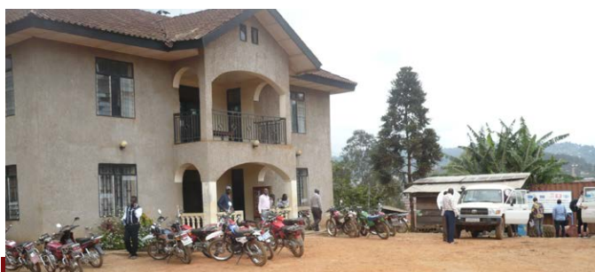
Bureau de la Caritas-Développement Butembo-Beni