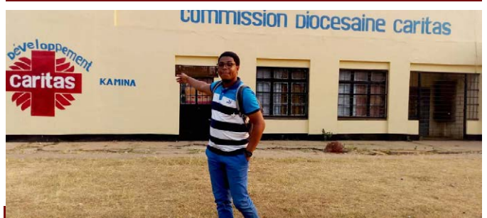
Bureau de la Caritas-Développement Kamina