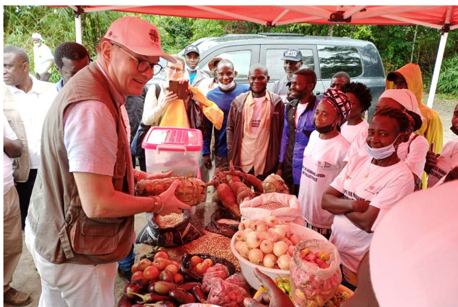
L'Ambassadeur de Norvège, avec une forte délégation de la Caritas Norvège, visitant le programme quinquénnal de sécurité alimentaire financé par NORAD, à Kasangulu en RDC.