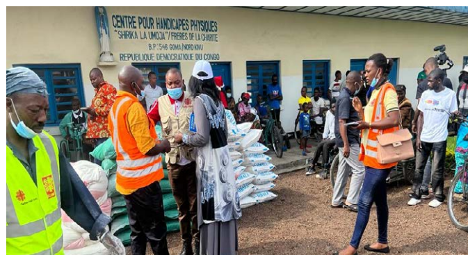
« Noël pour Tous »: remise des vivres au Centre pour personnes avec handicap Frère de la Charité à Goma