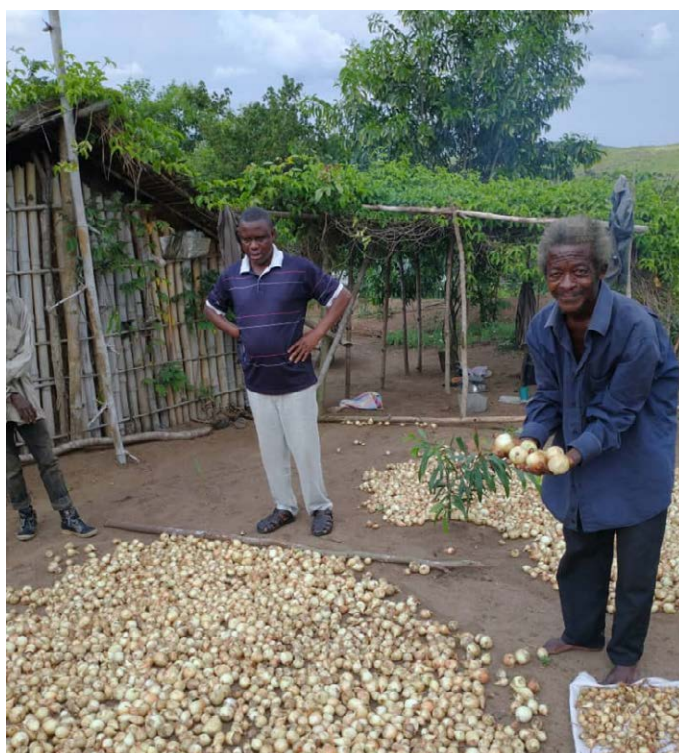
Le Directeur du BDD Kisantu visitant un ménage producteur d'oignons à Mvululu/SECAL

Grâce à 12.198.098,78 dollars américains qu'elle a pu mobiliser auprès de ses Partenaires et personnes de bonne foi, Caritas Congo Asbl a apporté des réponses aux préoccupations des populations vulnérables en RDC essentiellement dans ses trois domaines traditionnels d'intervention. Ces actions ont bénéficié à 3.084.952 personnes, qui ont été sensibilisées, assistées, soignées, appuyées et encadrées de diverses manières, et formées sur différentes thématiques.