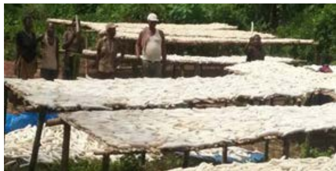
Séchage des cossettes de manioc à l'OP ADT/Kutsu/Budjala