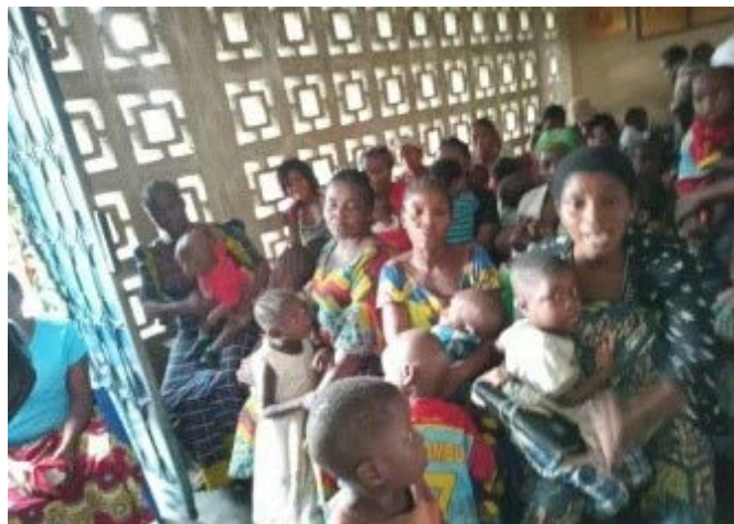
Séances médicales de dépistage & traitement des maladies de l'enfance, y compris le VIH à Kisangani

On dénote un gap de 63,64 % sur le traitement ARVs des enfants dépistés pendant les deux jours de la campagne. Cette situation démontre toujours que la disponibilité des ARVs pédiatriques se pose avec acuité dans la province et/ou dans les structures de prise en charge.