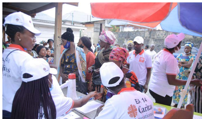
Cash Transfer pour le paiement des frais de loyer aux sinistrés de l'éruption volcanique de Goma