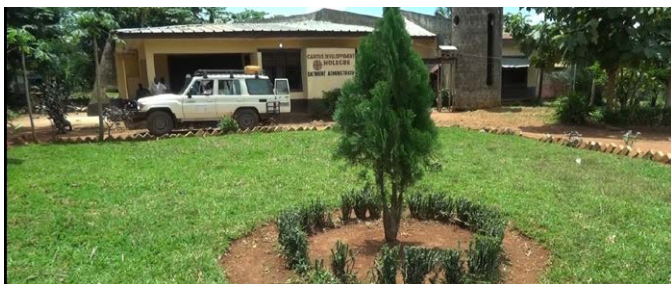
Bureau de la Caritas-Développement Molegbe

4. Contribuer à la consolidation de la bonne gouvernance et de la transparence dans la gestion des affaires publiques (implication du Réseau Caritas dans la mise en œuvre et le suivi des ODD (Agenda 2023) en rapport avec les engagements du Gouvernement congolais; Formation des animateurs de la Société Civile et des élus locaux au contrôle citoyen de l'action publique; publication, à travers les médias, des rapports de contrôle citoyen de l'action publique; etc);