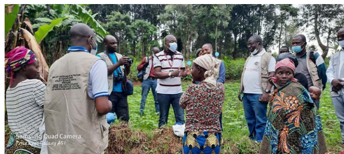
Entretien avec les bénéficiaires lors de la supervision du champ expérimental dans la zone de santé de Kalehe/PINS