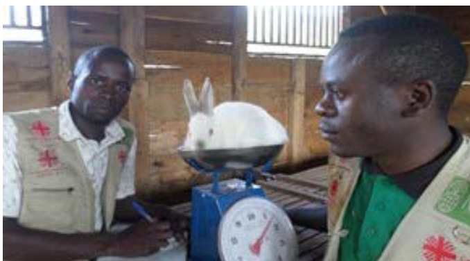
Distribution de lapins pour le métayage à Butembo-Beni