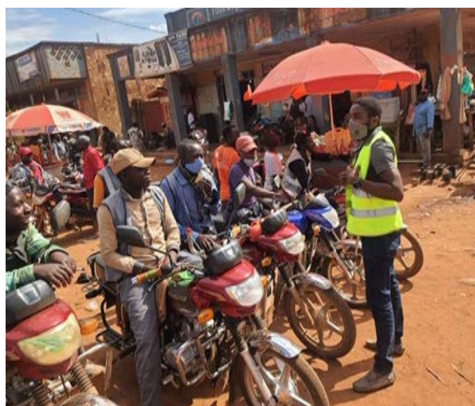
Un RECO de la ZS de Butembo sensibilisant les moto-taximen de la place