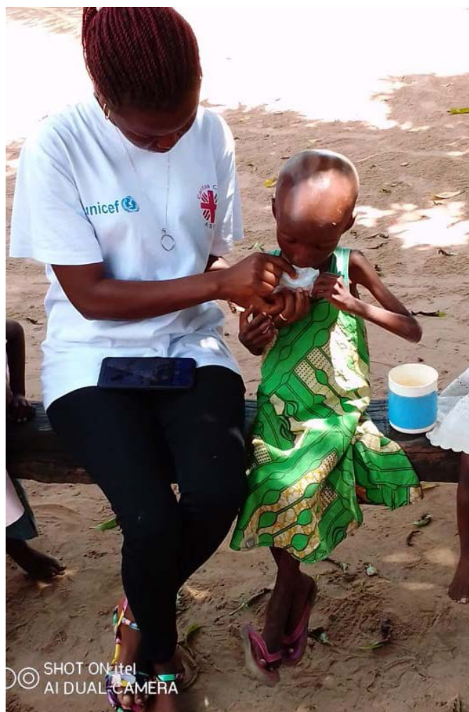
Une bénéficiaire consommant le plumpy nut, Zone de Santé de Tembo.

* 9.666/12.252 enfants de 6 – 23 mois qui ont reçu une alimentation adéquate de complément (3 repas par jour et au moins 4 groupes d'aliments) : 78,9% ;