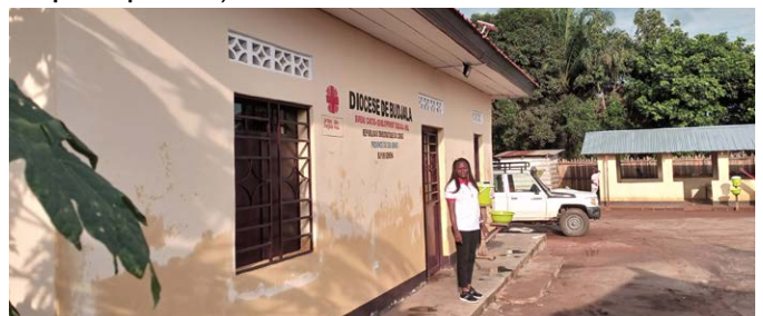
Bureau de la Caritas-Dév Budjala à Gemena