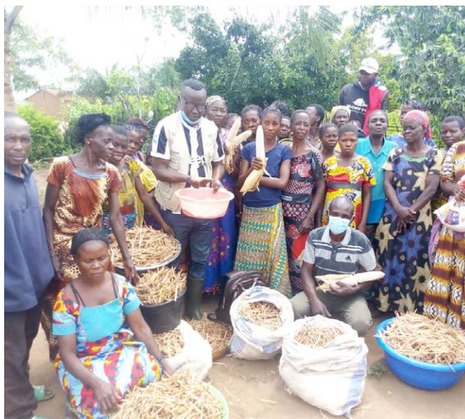
Des ménagères bénéficiaires fières de leurs productions de niébé, maïs, etc.; de quoi leur assurer des semences améliorées, au-delà de l'alimentation