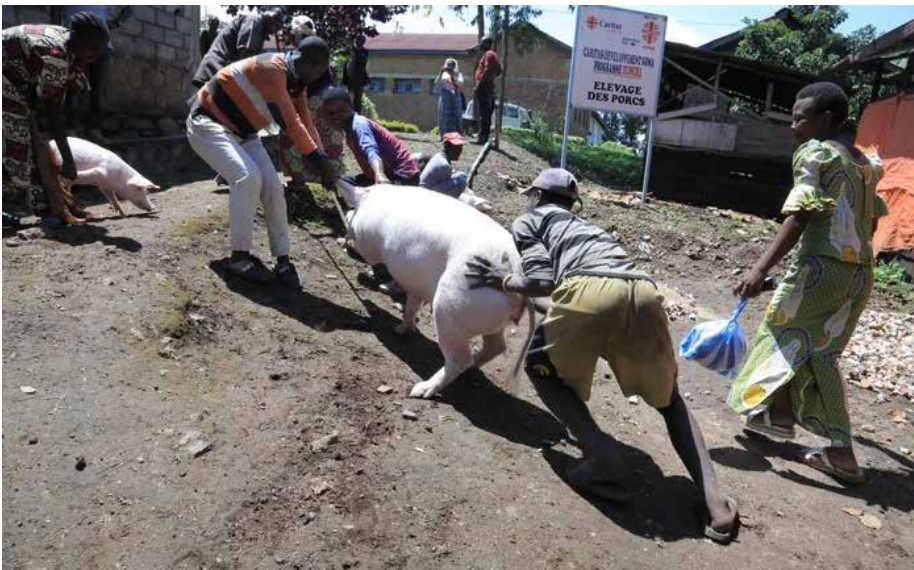
Un des porcs remis aux Associations Paysannes (APs) des Participants Communautaires (PCs) du Programme TUINUKE de Minova

A u total, 32 porcs ont été distribués aux Associations Paysannes (APs) des Participants Communautaires (PCs) du Programme TUINUKE (relevons-nous), se trouvant à Minova, une cité à 50 Km de Goma, dans l'Est de la République Démocratique du Congo. « Des porcs pour la paix » (Pig for Peace, en anglais) est une approche portée par ce programme pour rassembler ces communautés longtemps déchirées par des conflits intercommunautaires. Ainsi, autour de cet élevage associatif, ils pourront tous conjuguer les efforts dans l'élevage et vivre pacifiquement.