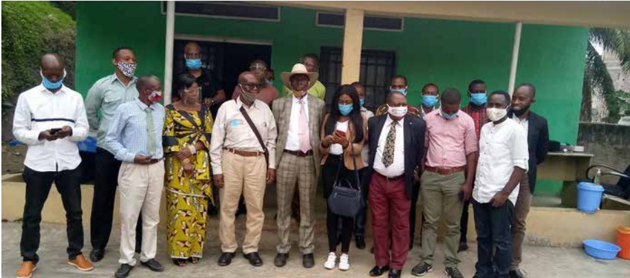
Photo de famille des participants à cet atelier sur la réforme de l'AT

Il s'est tenu du 26 au 27 juin 2020 un atelier de relecture de deux guides méthodologiques dans le cadre de la réforme de l'Aménagement du Territoire (AT), ainsi que de relecture des Termes de référence des groupes thématiques de l'AT par les experts des peuples autochtones pygmées. Ces assises ont eu lieu dans la salle de la réunion de la Ligue Nationale des Associations Pygmées du Congo (LINAPYCO), avec l'appui du Projet d'Appui aux Communautés Dépendantes de la Forêt (PAC-DF), financé par la Banque Mondiale et dont Caritas Congo Asbl joue le rôle d'Agence Fiduciaire.