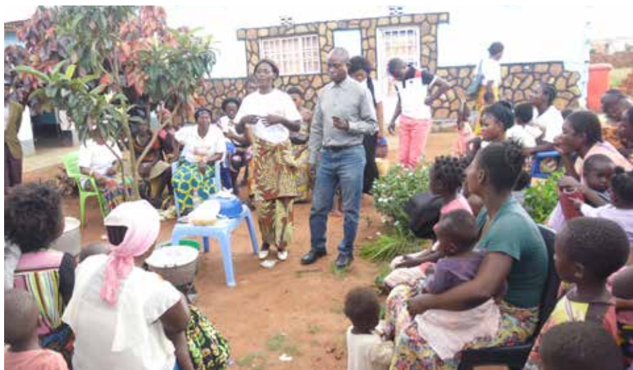
Des femmes enceintes, allaitantes et gardiens d'enfants sensibilisés sur l'alimentation du nourrisson et du jeune enfant et d'autres pratiques familiales essentielles.

Durant la même période (avril-juin 2020), 4.368 femmes