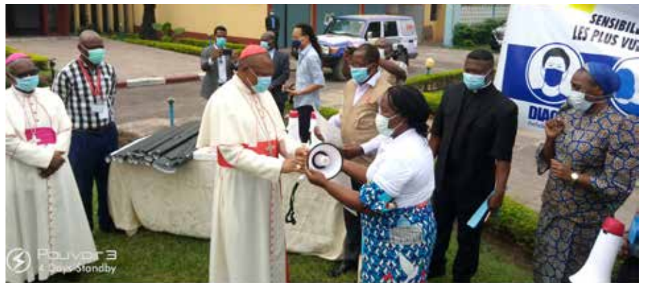
Le Cardinal Fridolin Ambongo, remettant symboliquement un mégaphone à la Directrice du BDOM Kinshasa pour la sensibilisation contre la Covid19

D'une durée de trois mois, ce projet va assurer la sensibilisation la plus large possible de la population de Kinshasa en déployant des crieurs, banderoles,