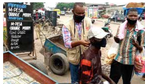
Un agent de la Caritas fait porter le masque à un charretier sensibilisé contre la Covid19

Le scepticisme évoqué par le Secrétaire Exécutif de la Caritas Congo Asbl a été constaté lors de la caravane motorisée partie de la 13ème rue Limeté jusqu'à la place Kintambo-Commercial, en passant par la Place Victoire