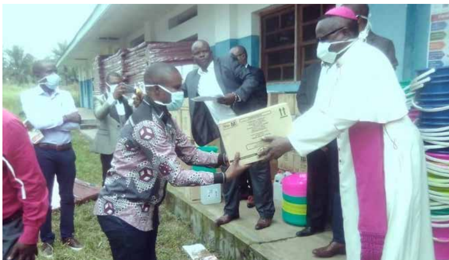
L'Evêque de Kikwit remettant symboliquement les équipements contre la Covid19 aux Centres hospitaliers dépendant de son BDOM

Pour rappel, selon le bulletin du mercredi 1er juillet 2020 du Comité Multisectoriel de riposte contre la Covid19 en RDC, le Kwilu