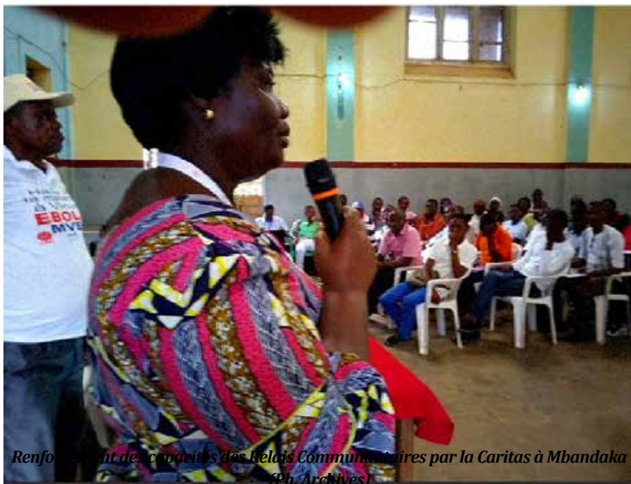
Renforcement des capacités des Relais Communautaires par la Caritas à Mbandaka

La Maladie à Virus Ebola (MVE) a été déclarée à Mbandaka lundi 1er juin 2020 par le Gouvernement Central, après sa confirmation par l'INRB (Institut National de Recherche Biologique). Cette épidémie a été localisée dans le quartier Air Congo, situé à moins de 5 kilomètres du centre-ville, dans l'Aire de Santé de Ipeko dans la Zone de Santé de Mbandaka, basée dans la commune de Mbandaka dans la province de l'Equateur.