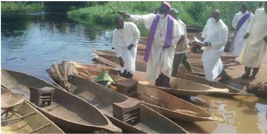
L'Evêque de Budjala bénissant les pirogues remises aux associations des pêcheurs

M onseigneur Philibert TEMBO, Evêque de Budjala, a procédé jeudi 04 juin 2020 à la remise des intrants de pêche, particulièrement 20 pirogues, à deux associations des pêcheurs Botana et Boso-Molanga à Budjala et APAKU (Association des Pêcheurs d'Akula) à Akula. La cérémonie s'est déroulée au bord de la rivière Saw, en présence des Autorités locales. Cette activité s'inscrit dans le cadre du Projet « Un Monde Sans Faim, sécurité alimentaire dans le nord - ouest de la RDC 2018-2022 ».