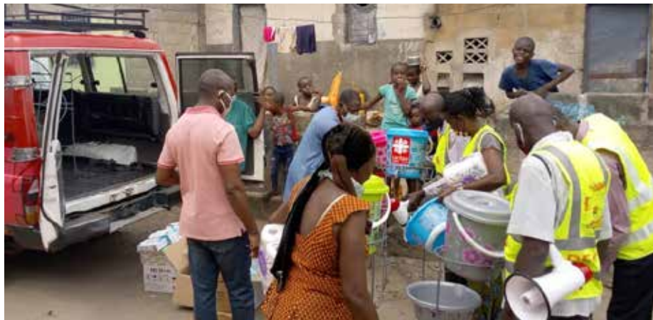
Des Relais Communautaires recevant des matériels contre la Covid-19 destinés au CS le Bon Berger, au camp Luka/Kintambo, difficile d'accès carrossable

C'est auprès d'IMA World Health qu'ACHAP a mobilisé son financement pour quelques pays