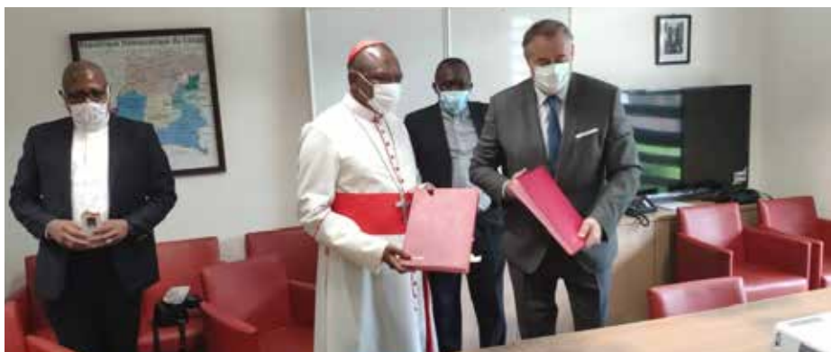
Le Cardinal Ambongo et l'Ambassadeur Pujolas, à la signature de la Convention en faveur des producteurs maraîchers de Kinshasa

L'Ambassade de France en RDC et la Caritas-Développement Kinshasa ont signé une convention de partenariat pour augmenter la production agricole de 1.700 producteurs maraîchers et 800 producteurs vivriers de la capitale de la RD Congo en ce temps de la maladie à Coronavirus 2019 (Covid-19). La cérémonie y afférente s'est déroulée le 29 avril 2020 à l'Ambassade de France à Kinshasa. L'Ambassadeur de France en RDC, Mr François Pujolas, et le Cardinal Fridolin Ambongo, en sa qualité de Président de la Caritas-Développement Kinshasa, ont ainsi signé cette convention pour un montant de 280.000 dollars américains.