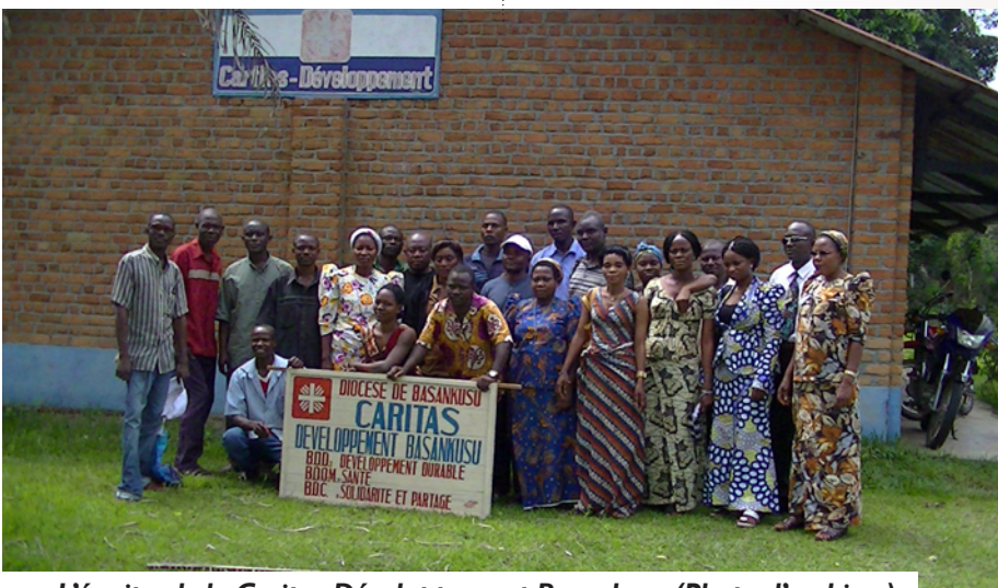
L'équipe de la Caritas-Développement Basankusu (Photo d'archives)

Par ailleurs, érigé le 10 novembre 1959, le Diocèse de Basankusu est limité au Nord par le Diocèse de Lisala. A l'Est, il est borné par le Diocèse d'Isangi ; au Sud par Bokungu-Ikela et l'Archidiocèse de Mbandaka-Bikoro ; enfin à l'Ouest par le Diocèse de Budjala.