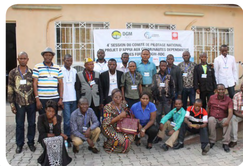
Photo de famille des participants à la 4ème session du Comité de Pilotage National au Centre Caritas