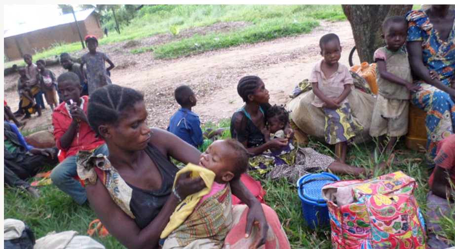
Des déplacés épuisés par la marche à pied, transitant à Mweka pour rentrer à Dekese

Le 11 mars 2017, l'incursion de la ville de Mwene-Ditu, Diocèse de Luiza, par des miliciens de « Kamuina Nsapu » s'est soldée par d'énormes dégâts matériels, des blessés et des pertes en vies humaines.