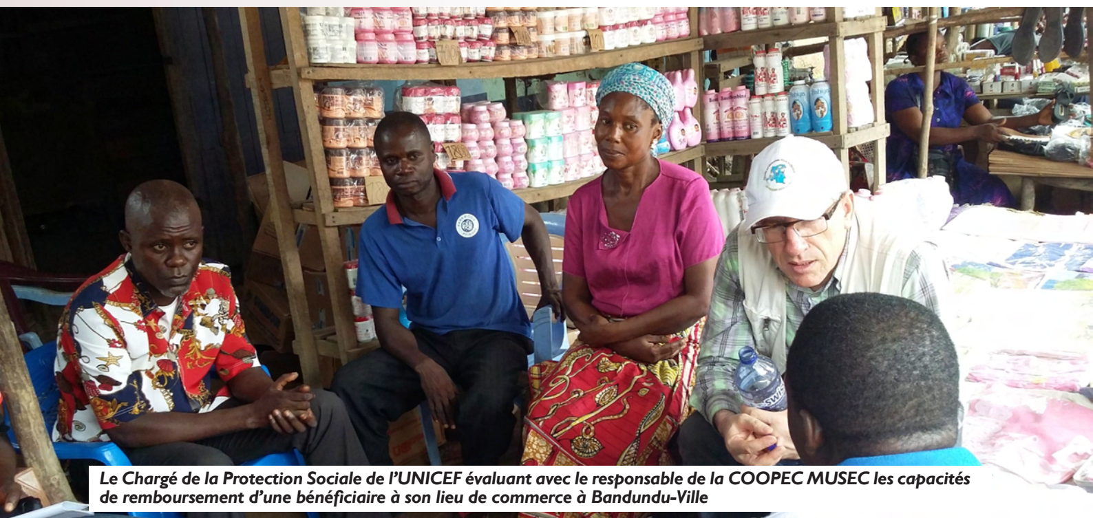
Le Chargé de la Protection Sociale de l'UNICEF évaluant avec le responsable de la COOPEC MUSEC les capacités de remboursement d'une bénéficiaire à son lieu de commerce à Bandundu-Ville