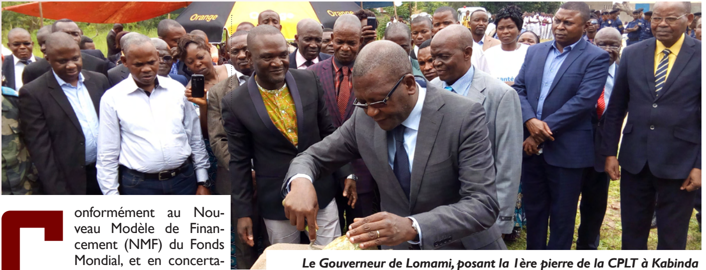
Le Gouverneur de Lomami, posant la 1ère pierre de la CPLT à Kabinda

C onformément au Nouveau Modèle de Financement (NMF) du Fonds Mondial, et en concertation avec le Programme National de Lutte contre la Tuberculose (PNLT), Caritas Congo Asbl s'est engagée à doter les nouvelles Provinces des bâtiments de CPLT: Coordinations Provinciales Lèpre-Tuberculose.