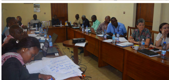
Vue des participants à la réunion de coordination à Kinshasa

grammes ont été tenus comme prévus, notamment à Kisantu du 10 au 14.10.2016 pour le programme d'appui à la sécurité alimentaire et à Mambasa (Diocèse de Wamba) du 05 au 11.12.2016 pour celui d'amélioration à l'accès et de la qualité de l'éducation.